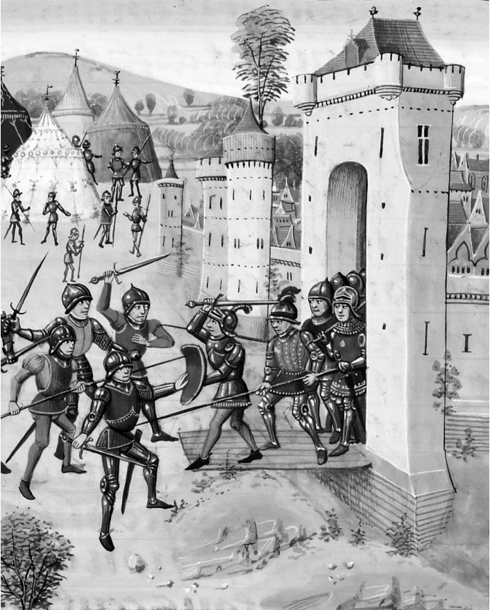
Belägringen av Hennebont, som den illustreras i en krönika från 1400-talet.

Den stora frågan är dock en annan. Har detta någonsin hänt? Vad vet vi om författaren?